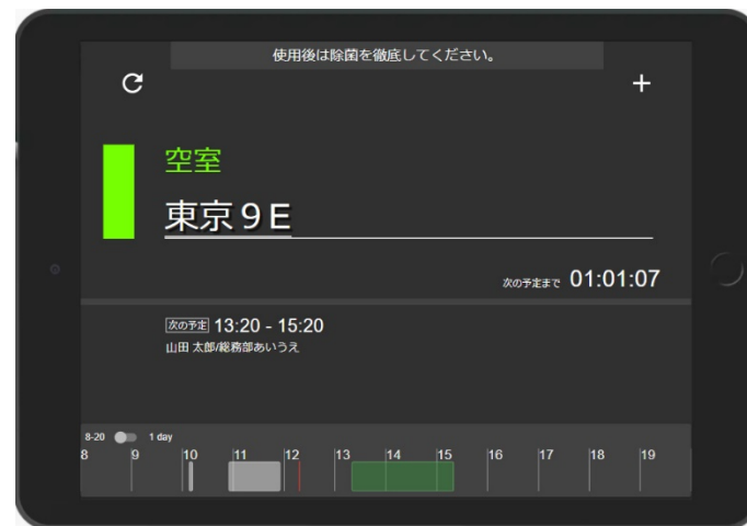
空き (次の会議あり)